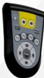
Pilot radiowy zdalnego sterowania.

Szafka komputerowa z zasilaczem + zestaw PC wysokiej klasy z monitorem i drukarką. Oprogramowanie z bazą danych z bezpłatną aktualizacją ( 38 tys. modeli samochodów).