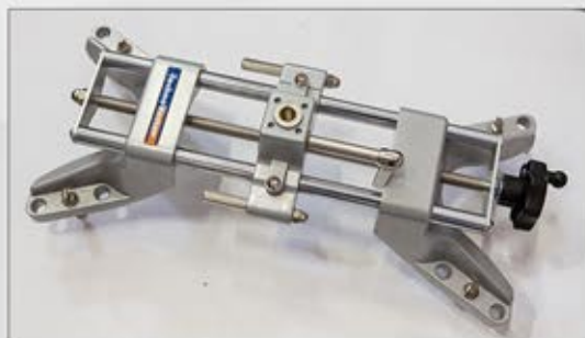
Uchwyty na obręcze kół 12" - 24".