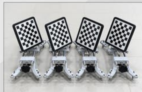
Tarcze kodowe 4 małe.