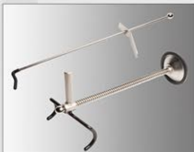
Blokada kierownicy i pedału hamulca.